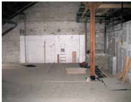
Klima- und Anlagentechnik Schindler GmbH

Der Feuchtekontrolle in der Raumluft muss also große Aufmerksamkeit gewidmet werden. Zusätzlich kann, je nach Wetterlage, die angesaugte Frischluft wegen der umliegenden Wasserflächen eine hohe relative Luftfeuchte aufweisen. Insgesamt führt dies zu einem hohen Spitzenbedarf an Kühlleistung, um die notwendige Entfeuchtungsleistung in den Lüftungsgeräten zu gewährleisten, während zu anderen Zeiten zwar stetig, aber nur in geringerem Maße, Kühlleistung gebraucht wird. Bei einem solchen Lastverlauf macht sich besonders der Vorteil der eingesetzten Kältemaschine mit Turbocor-Verdichtern bemerkbar, die im Teillastbereich sehr hohe Wirkungsgrade von bis zu über 10 (EER) erreicht.