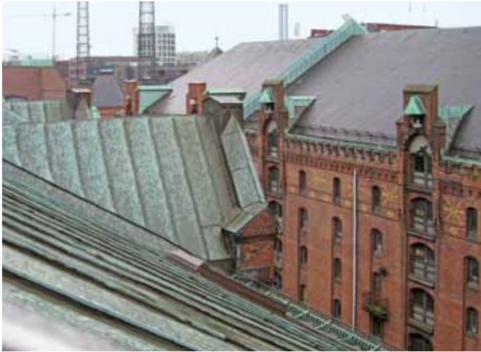
Klima- und Anlagentechnik Schindler GmbH