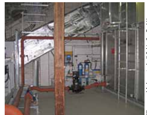
Klima- und Anlagentechnik Schindler GmbH