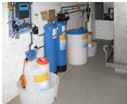
Klima- und Anlagentechnik Schindler GmbH