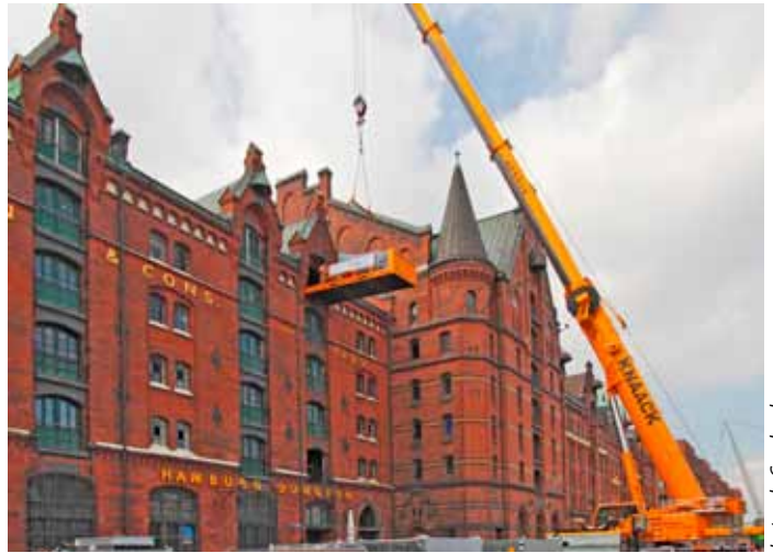
Justus de Cuveland