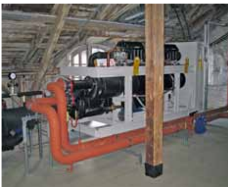
Klima- und Anlagentechnik Schindler GmbH

Durch feinverzahnte Zusammenarbeit der verschiedenen Gewerke konnte die Anlage innerhalb von nur vier Wochen bei laufendem Betrieb in der Ausstellung eingebracht, aufgebaut und in Betrieb gesetzt werden. Eine Präsentation der neuen klimatechnischen Anlage hat das Miniatur Wunderland in einem eigens gedrehtem Video unter folgendem Internet-Link veröffentlicht: http://tagebuch.miniatur-wunderland.de/eintrag/gerrits-tagebuch-vol-33-klimasteuerung-bilder-testfluegen-china-eastern-a330 .