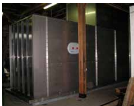
Klima- und Anlagentechnik Schindler GmbH